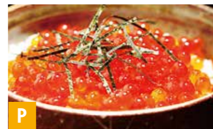
P 北海道いくら醤油漬け 70g×6本 ※冷凍保存 30日