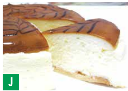
J パティスリーベンス エクストラチーズケーキ エクストラチーズケーキ 5号×1 ※冷凍保存 60日