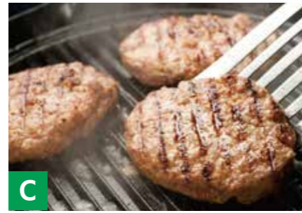
C 焼肉「BULLS」国産黒毛和牛入ハンバーグ 粗挽生ハンバーグ約100g×4 ※冷凍保存 30日