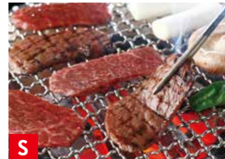
S 神戸牛 モモ焼肉用 モモ 約450g ※冷凍保存 30日