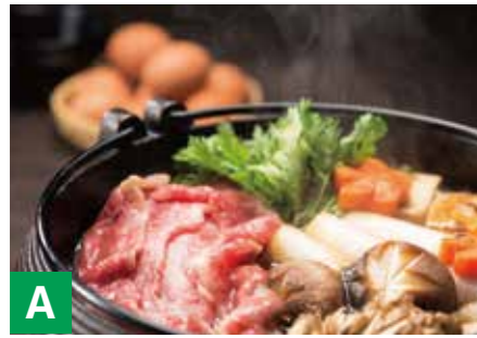
A 北海道かみふらの和牛ももばらすき焼き もも・ばら 約180g ※冷凍保存 30日