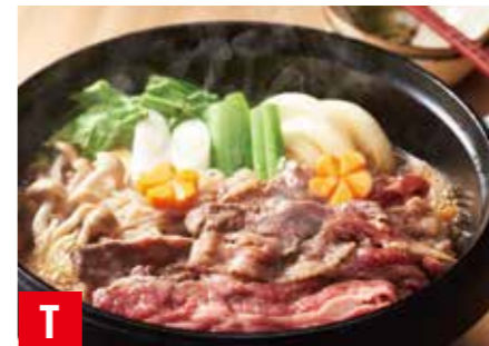
T 九州産 黒毛和牛すきやき 肩ロース 約1.1kg ※冷凍保存 30日