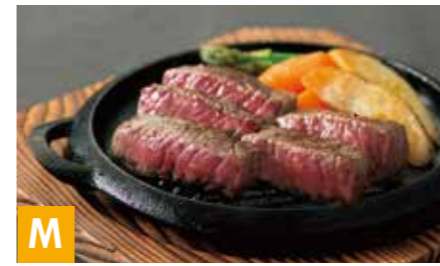
M 信州アルプス牛ステーキ用モモ ステーキ用モモ 80g×6 ※冷凍保存 30日