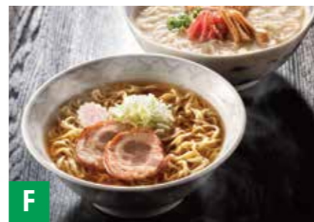
F 乾燥全国めん自慢12食 札幌ラーメン味噌、喜多方ラーメン醤油、 横浜ラーメン醤油、和歌山ラーメン豚骨醤油、 神戸ラーメン醤油、博多ラーメン豚骨×各2人前 ※常温保存 180日