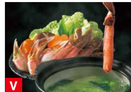
V 生ずわいかにしゃぶセット 脚ポーション 約500g、 爪ポーション 約500g ※冷凍保存 60日