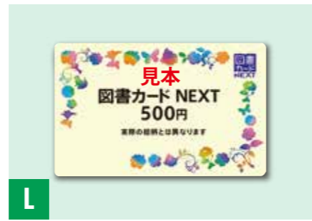
L 図書カードNEXT 2500円分