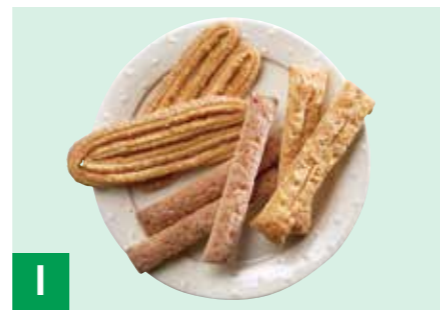
I 神戸パイ3種のパイセレクトBOX アーモンド×20、ジュリエットパイ×20、 六甲チーズパイ×20、 ※常温保存 30日