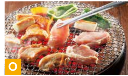
O 熊本県産大阿蘇どり焼肉用モモ・ムネ肉 ムネ 600g、モモ 600g ※冷凍保存 30日