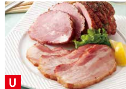
U 岩手ハムギフトセット ホワイトロースハム 約400g、ボンレスハム 約340g、 焼豚 約300g、バストラミポーク 約280g、 ミートローフ 約280g ※冷蔵保存 60日