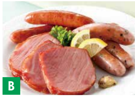
B ふらのハム&ウイナーギフトセット ショルダーハム 約270g、 あらびきウイナー 約130g、 ホワイトウイナー 約130g ※冷蔵保存 50日