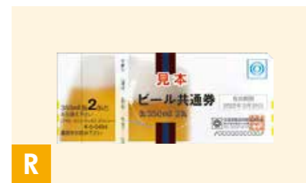
R ビール共通券(缶350ml 2缶)12枚 缶350ml×24缶分