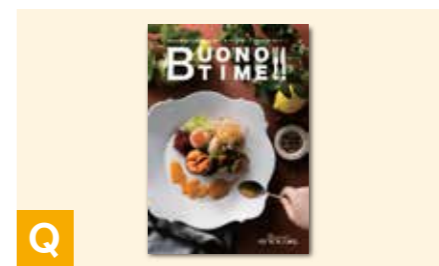
Q グルメカタログギフト<ブルーテ> 掲載商品点数/約250点 ページ数/100ページ