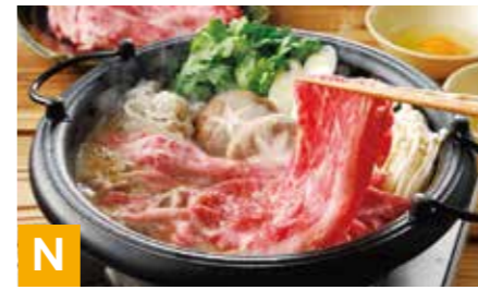
N 松阪牛すき焼き肉 すき焼もも 300g ※冷凍保存 30日