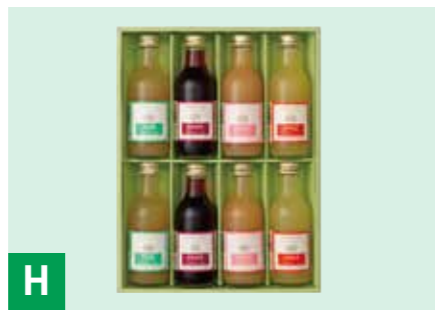
H 長野県産果汁100%ジュース詰合せ りんご(ふじ) 200ml×2、ぶどう(巨峰) 200ml×2、 桃 200ml×2、ラ・フランス 200ml×2 ※常温保存 540日