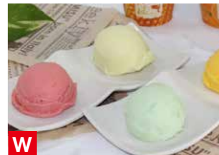
W ハーゲンダッツ&フルーツティアラアイスセット ハーゲンダッツ(バナナ、グリーンティー、クッキー&クリーム、マカデミアナッツ) 各2、ラバースコレクションマルチX1、クラシックコレクションマルチX1、 フルーツティアラソルベ(青りんご、苺、ハイアッブル、ミカン)×各3 ※冷凍保存 365日