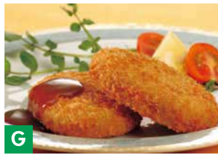
G 鹿児島産黒毛和牛入りビーフコロッケ ビーフコロッケ約60g×15 ※冷凍保存 60日