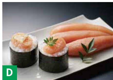
D 福さ屋無着色辛子明太子 無着色辛子明太子 270g ※冷蔵保存 14日