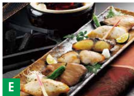
E 漬魚三彩 クロカジキ粕漬 約70g、クロカジキ西京漬 約70g、 カマスサワラ粕漬 約80g、カマスサワラ西京漬 約80g、 キハダマグロみりん醤油漬 約80g、味噌漬 約80g×各1 ※冷凍保存 60日